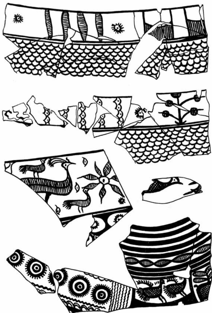
Рис. 2. Образцы расписной керамики.