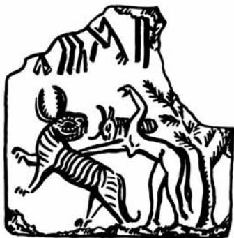
Рис. 4. Богиня с тигром.

ния и знание ритуально-мифологических тонкостей были уделом и прерогативой узкого круга образованного жречества. Основная же масса адептов оставалась им чужда, подходя к религии преимущественно с утилитарными целями и имея во главе угла помощь в повседневных делах и удовлетворение определенных эстетических и эмоциональных запросов. Как сможем мы узнать об этом?